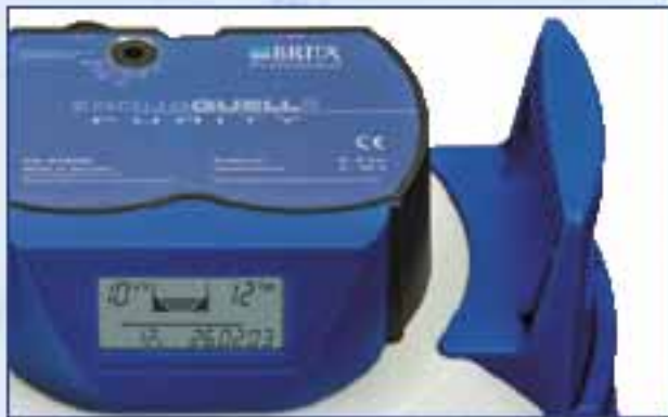
Druckbehälterdeckel mit Verschnitteinstellschraube und digitaler Anzegeeinheit