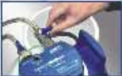
Variable Verschnitteinstellung von 0–50%, je nach Ihren individuellen Anforderungen