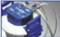
Kartuschenwechsel ohne Demontage der Schläuche

Das bis ins Detail durchdachte System überzeugt durch eine besonders komfortable Handhabung, die viel Zeit und Aufwand spart: Einmal angeschlossen, bleibt das System installiert – das Wechselkartuschen-Prinzip macht's möglich!